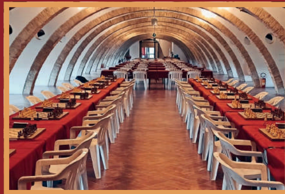
Sede di gioco, Ex Caserma Napoleonica Montesanto