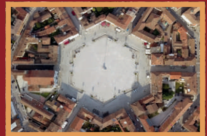
Piazza Grande vista dall'alto