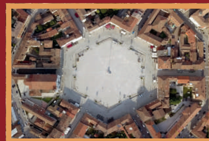
Piazza Grande vista dall'alto