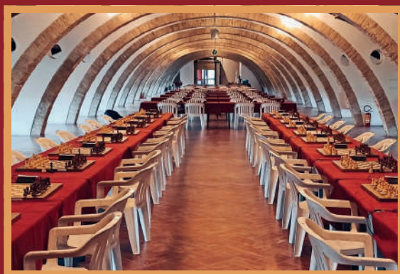
Sede di gioco, Ex Caserma Napoleonica Montesanto