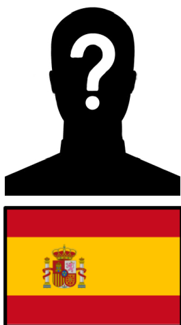
Francisco de Castellvi